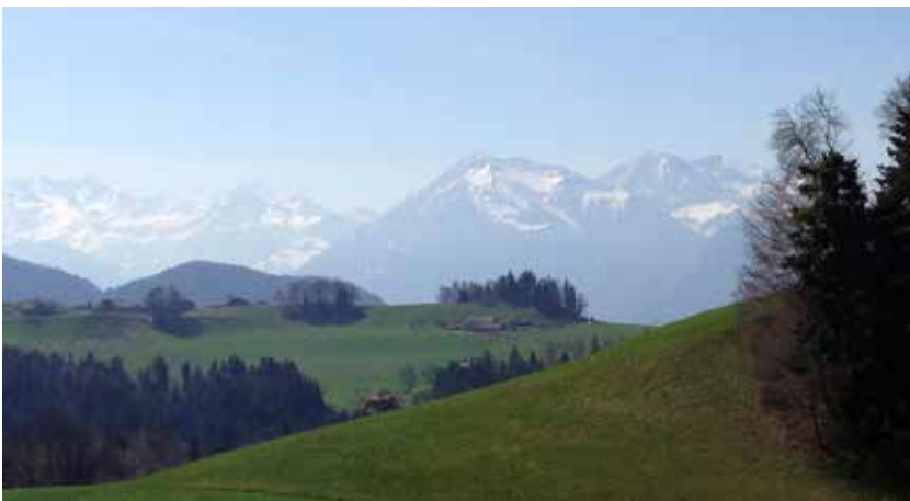
Conducir por un paisaje maravilloso es solo una de las ventajas del trabajo en ventas.

MI PREOCUPACIÓN INICIAL QUE LOS ASESORES TÉCNICOS SON GUERREROS SOLITARIOS SE HA DEMOSTRADO EN GRAN MEDIDA INFUNDADA.