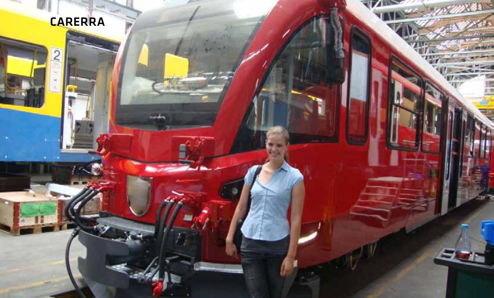
Visitando Stadler Rail en Suiza.