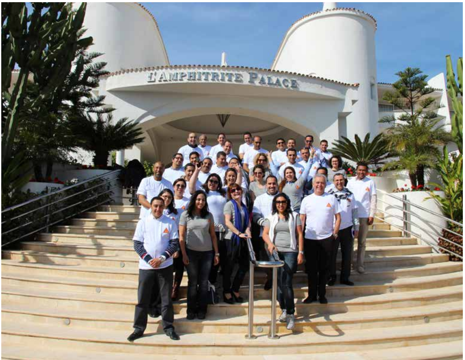
Los equipos de Ventas y Administración de Sika Maroc.

> tivo construir un fuerte sector industrial y crear un círculo virtuoso de crecimiento. El estado y el sector privado han sellado este pacto mediante la firma de un programa contrato para el período 2009-2015. Al consolidar los compromisos mutuos en un documento, los socios aportan a los inversores la necesaria visibilidad sobre los cambios de la futura industria marroquí. Este pacto de emergencia establece objetivos específicos en términos de contribución al PIB, las exportaciones y el empleo de seis sectores considerados de elevado potencial de crecimiento: la aeronáutica, la externalización, la alimentación, la industria textil, la electrónica y la automoción.