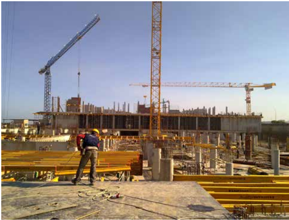
El famoso proyecto Marina Casablanca, el prometedor centro multipropósito de la ciudad de Casablanca.