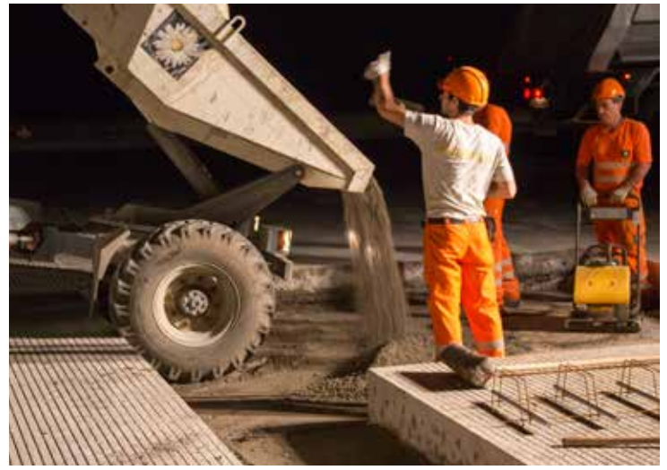
Hace falta un buen sentido de proporciones para estimar cuanto hormigón magro se necesita.