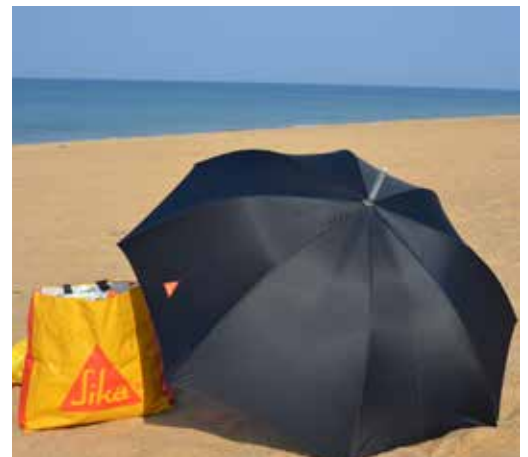
Sika para las vacaciones.

me permitieron adquirir un conocimiento importante sobre la estructura de la empresa. Incluso, tuve la experiencia de poder ayudar con las pruebas de productos en Hagerbach Test Gallery y en la planta de cementos Richi en Weinigen.