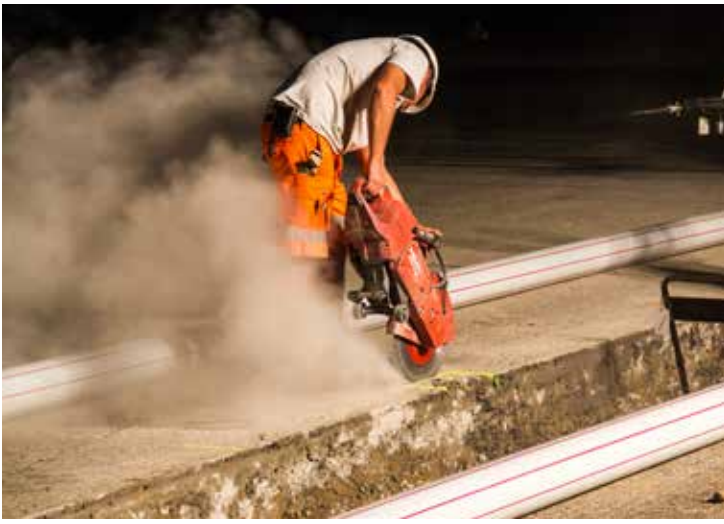
Trabajo minucioso en condiciones difíciles.