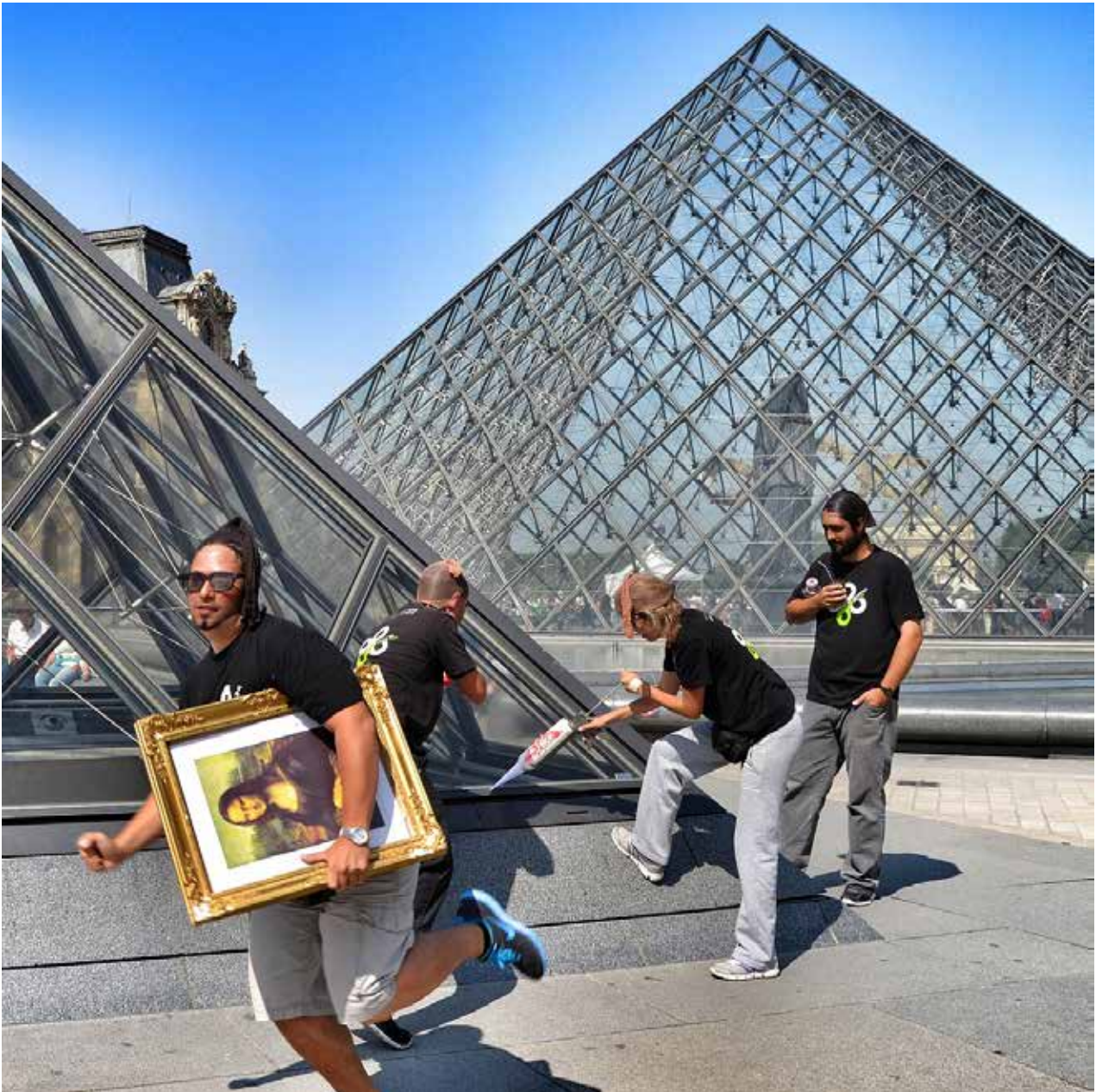
Robando Mona Lisa. La foto ganadora.