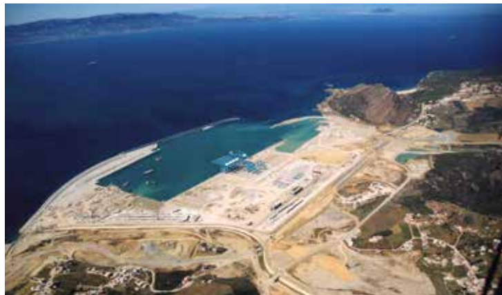
El proyecto Tanger-Med.